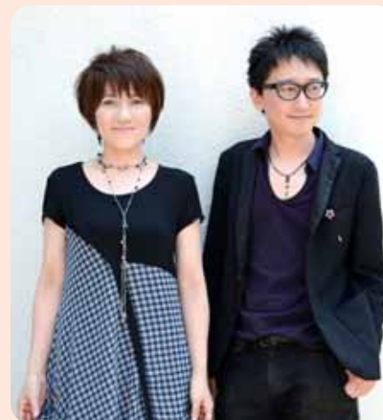
大ヒット「冬のファンタジー」などで人気

介護用品・医療用かつら・アロマ等の無料体験 栄養補助食品・口腔ケアグッズの紹介、配布 杉並区内の医療や介護の情報提供 写真や絵画の展示 など ※プログラムを変更する場合がありますのでご了承ください。