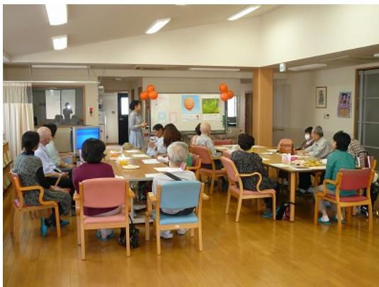
患者・家族のための緩和ケアサロン (新国内科医院・兵庫県)