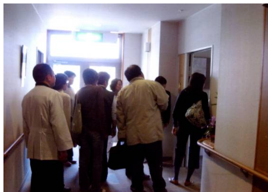
緩和ケア病棟見学会 (公立みつぎ総合病院・広島県)