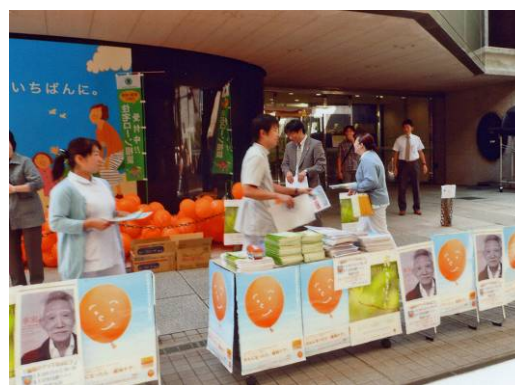
街頭でのチラシ・バルーン配布 (佐世保中央病院/佐世保市立総合病院共催・長崎県)