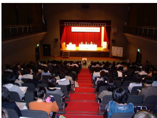
一般市民対象の公開講座 (滋賀県がん診療連携協議会緩和ケア推進部会※・滋賀県)