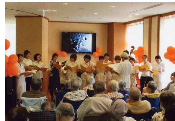
病院職員によるコンサート (彩都友誼会病院・大阪府)