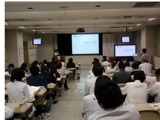
医療従事者向けの勉強会 (東邦大学医療センター大橋病院・東京都)