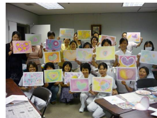
カラーセラピー体験講習会 (琉球大学病院・沖縄県)