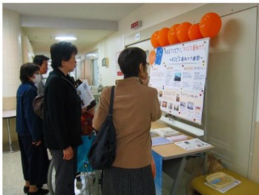
パネル展示 (札幌南青洲病院・北海道)

※滋賀県がん診療連携協議会緩和ケア推進部会：滋賀県がん対策推進計画に基づき、滋賀県立成人病センター(事務局)、彦根市立病院、大津市民病院、ヴォーリス記念病院他、医師会、患者会、行政担当者等で構成された部会