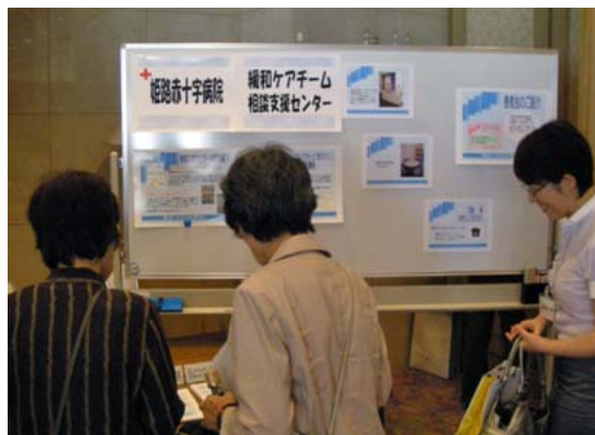
3病院による合同展示・相談会 (姫路聖マリア病院/姫路医療センター/姫路赤十字病院共催・兵庫県)