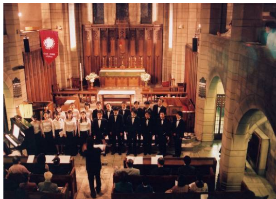
ハレルヤ合唱 (聖路加国際病院/ピースハウス病院共催・東京都)