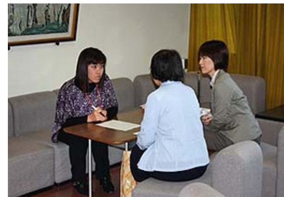
フォーラム後の緩和ケア相談 (松山ベテル病院・愛媛県)