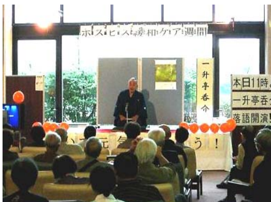
落語会 (名古屋医療センター・愛知県)